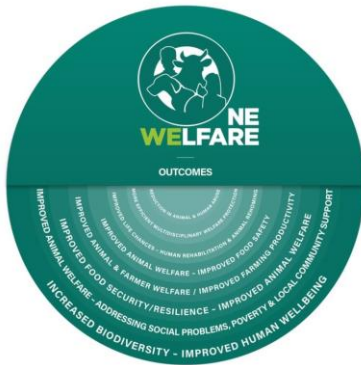
Фиг. 4: ползи от „Едно Благосъстояние“ по дизайн на R. Held