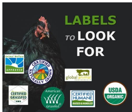
Частни и доброволни схеми за сертифициране и етикетиране на продукти, добити при по-високи стандарти

Съществено е, че за да се стимулира промяната и да се постигне по-висок пазарен