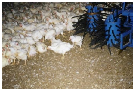
Машина за хващане на птици

* Разреждане - технологията на разреждане на стадото включва отглеждане на птиците до максимално допустима гъстота на отглеждане и след това отстраняване на част от тях, обикновено 25-30%, като се избират различните по тегло, за да се намали плътността. Редица проучвания на показателите за ефекта от разреждане сочат, че по-голямата част от фермите за бройлери прилагат разреждането като рутинна практика, от които 30% разреждат стадото няколко пъти по време на