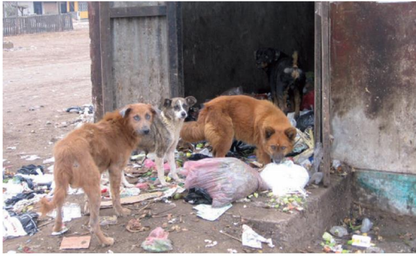
Снимка: Бездомни кучета, търсещи храна в боклука, Перу

Все пак най-добрият вариант е да бъде разработена пълна програма за контрол на популацията от кучета, която да включва и паралелни мероприятия по профилактика на зоонозите.