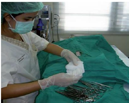
Хирург използва асептична техника, Тайланд

е. водене на протоколи и периодичен анализ на данните - дори без да влияе директно върху благосъстоянието на животните, доброто водене на документация, което разкрива честотата на заболяванията или травмите, може да помогне за идентифицирането на онези части от програмата, които може да са компрометиращи за благосъстоянието на животните. Например, една обичайно висока честота на пост-оперативните усложнения за определено време може да е индикатор за необходимост от опреснителен курс за обучение на определен ветеринарен екип или за промяна в пост-оперативните грижи.