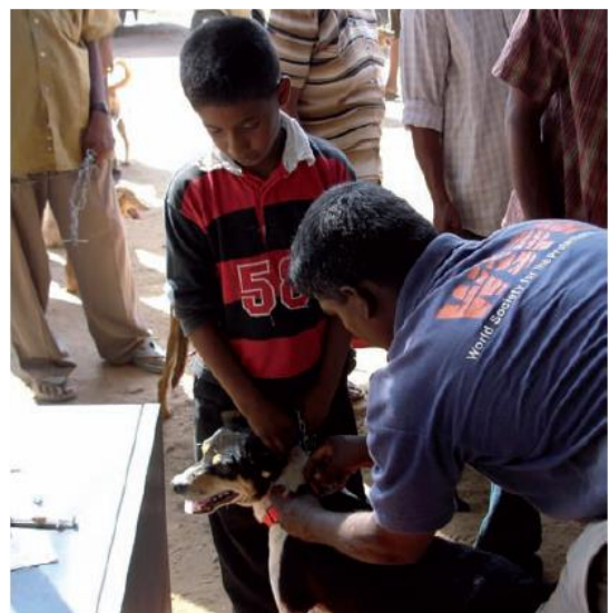
Поставяне на червен нашийник на куче, което е ваксинирано срещу бяс и обезпаразитено в Шри Ланка

д. Насърчаването на редовните профилактични мерки позволява навременно диагностициране във всяка една ситуация на евентуално заболяване.