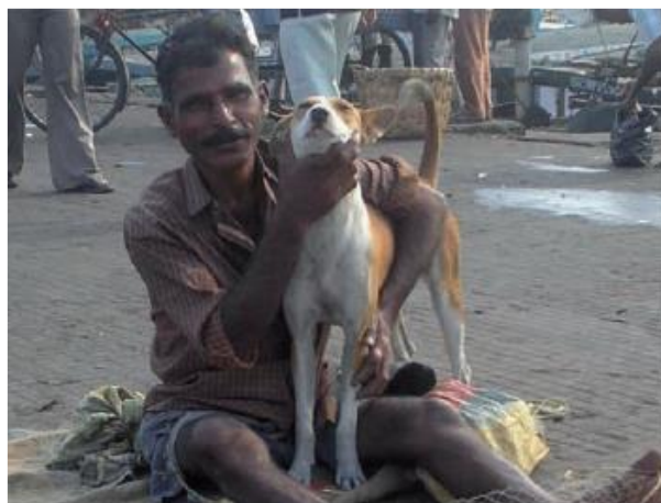
Рибар и квартално куче в Индия