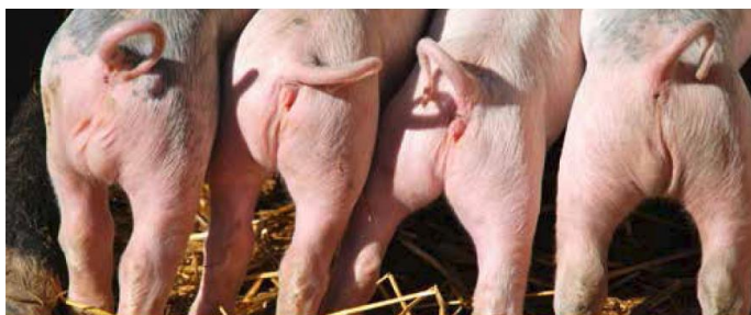
Брошура защо прасетата хапят опашките? (26.6.2018г.)

http://www.babh.government.bg/bg/Page/opashki/index/opashki/%D0%9A%D1%83%D0%BF%D0%B8%D1%80%D0%B0%D0%BD%D0%B5%20%D0%BD%EF%BF%BD