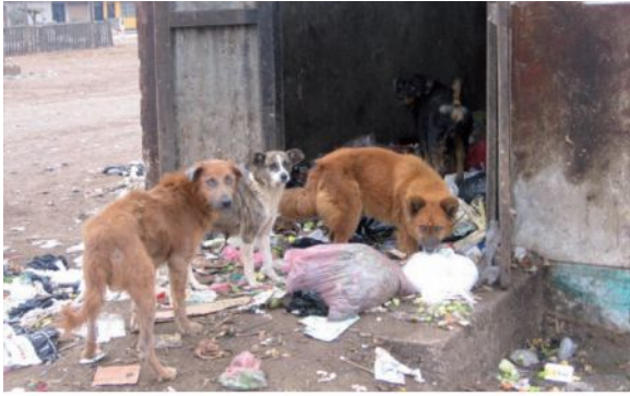
Снимка: Бездомни кучета, търсеци храна в боклука, Перу

Все пак най-добрият вариант е да бъде разработена пълна програма за контрол на популацията от кучета, която да включва и паралелни мероприятия по профилактика на зоонозите.