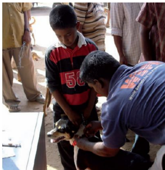
Поставяне на червен нашийник на куче, което е ваксинирано срещу бяс и обезпаразитено в Шри Ланка

д. Насърчаването на редовните профилактични мерки позволява навременно диагностициране във всяка една ситуация на евентуално заболяване.