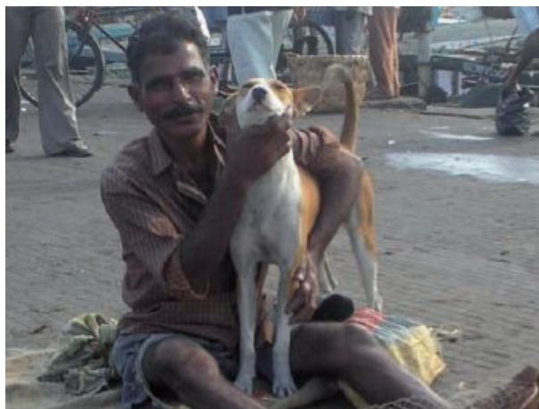
Рибар и квартално куче в Индия