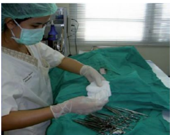
Хирург използва асептична техника, Тайланд

е. водене на протоколи и периодичен анализ на данните - дори без да влияе директно върху благосъстоянието на животните, доброто водене на документация, което разкрива честотата на заболяванията или травмите, може да помогне за идентифицирането на онези части от програмата, които може да са компрометиращи за благосъстоянието на животните. Например, една обичайно висока честота на пост-оперативните усложнения за определено време може да е индикатор за необходимост от опреснителен курс за обучение на определен ветеринарен екип или за промяна в пост-оперативните грижи.