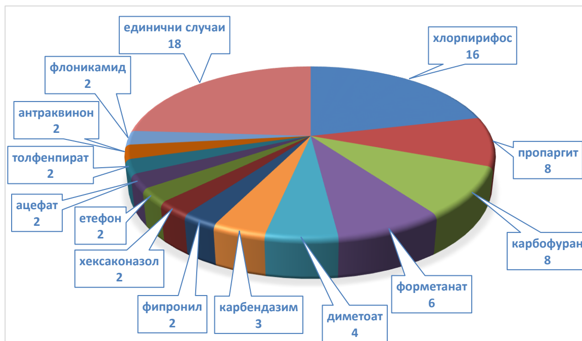
Фиг. 2 Брой случаи на замърсяване с различни пестицидни остатъци в продуктите през периода 01 октомври – 31 декември, 2017 год

Най-голям брой остатъци са установени от пестицидите: фипронил - 26 , хлорпирифос – 16 , пропаргит – 8 , карбофуран – 8 , форметанат – 6 , диметоат – 4, карбендазим – 3, по 2 от фипронил, хексаконазол, етефон, флоникамид, ацефат, толфенпират, антраквинон и 18 единични случая (Фиг. 2).