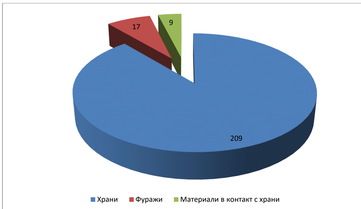
Фиг. 1 Анализ на нотификациите по отношение на разпределението по групи: храни, фуражи и материали в контакт с храни.

Общият брой нотификации за месец юни 2020 г. е 235. Сигналите в категория храни са най-много – 209, за фуражите – 17, а за материалите в контакт с храни – 9 (фиг.1).