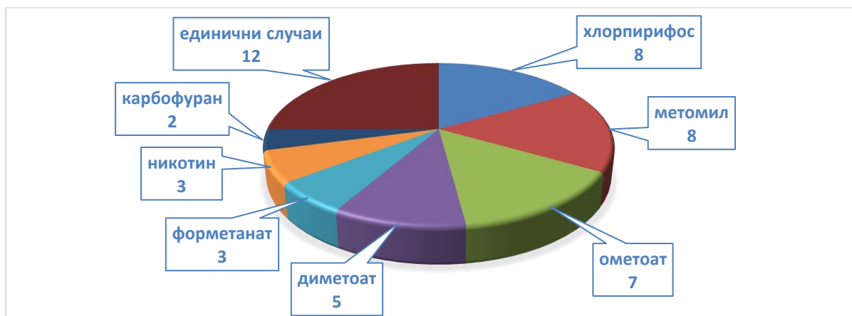
Фиг. 2 Брой случаи на замърсяване с различни пестицидни остатъци в продуктите през периода 01юли – 30 септември, 2018 год.

Най-голям брой остатъци са установени от пестицидите: хлорпирифос и метомил по 8 , 7 за неразрешената субстанция ометоат , 5 за диметоат , 3 за форметанат , 3 за неразрешената субстанция никотин , 2 за неразрешената субстанция карбофуран и по 1 нотификация за протиофос, имазалил, прохлораз, фостиазат, клофентезин, фенамифос и неразрешените субстанции – профенофос, карбарил, бифенил, перметрин, хексаконазол, метамидофос. (Фиг. 2).