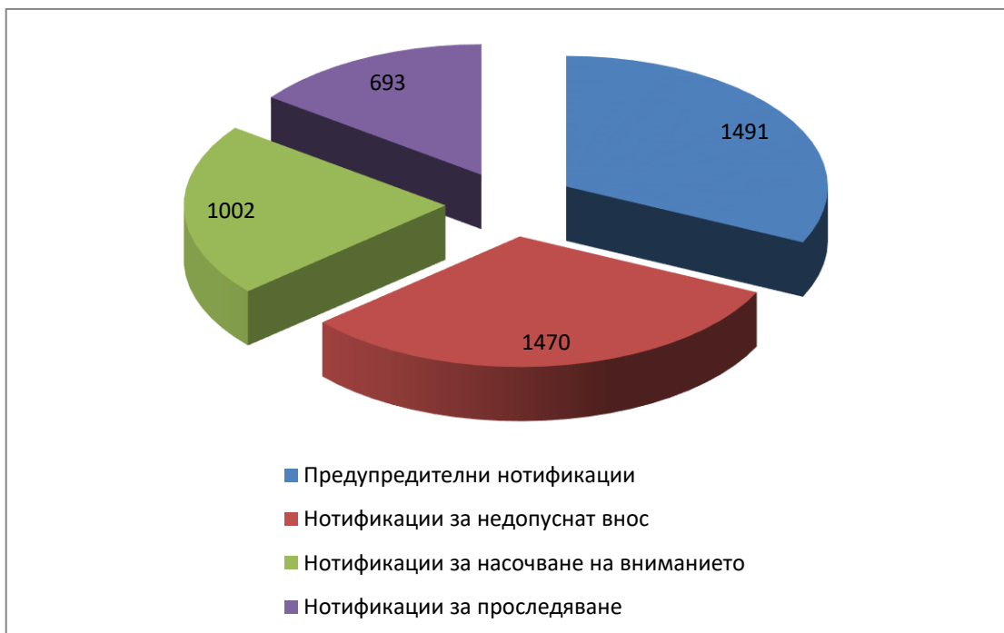
Фиг. 2 Анализ на нотификациите по отношение на разпределението по видове нотификации.

При разпределението на нотификациите по месеци се наблюдава следната тенденция: повишение се наблюдава през март (396), май (387), юни (429), юли (409), октомври (418), ноември (425) и декември (494). Спад се наблюдава през януари (325), февруари (319), април (303), август (380) и септември (387).