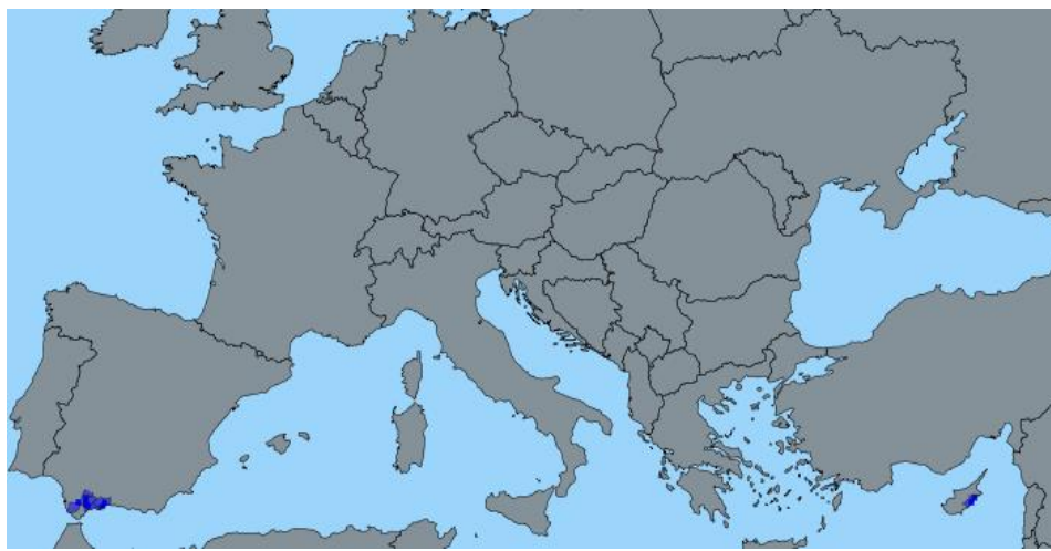
фиг. 2 Огнища на син език, 10 - 16.11.2018 г.

огнища (серотип 04) при сентинелни животни в Cartama, Ronda, Malaga, La Janda, Sierra de Cadiz и Estepona. (фиг. 2)