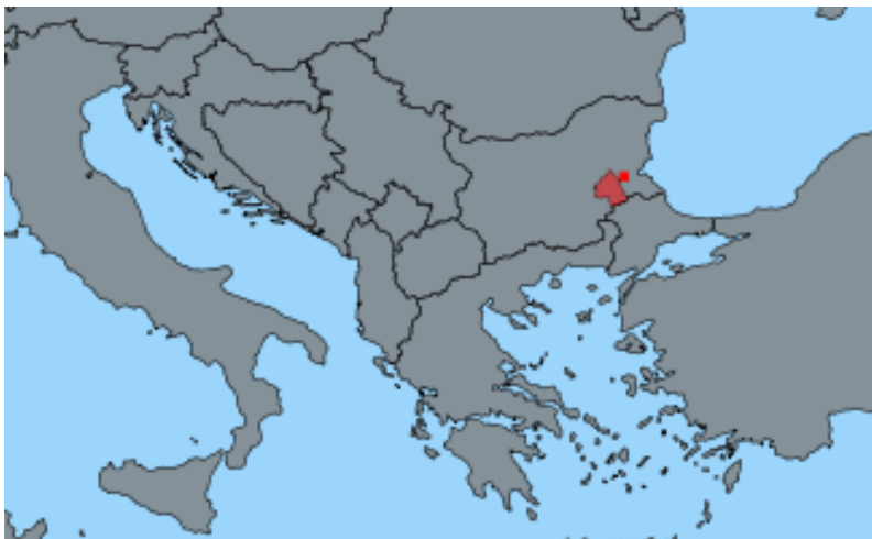
фиг. 1 Огнище на високопатогенна Инфлуенца при домашни птици в България 22.11.2018 г.

На 22.11.2018 г. е потвърдено огнище на високопатогенна Инфлуенца (H5) при домашни птици в България . Засегнато е лично стопанство, в което се отглеждат 50 броя птици, в с. Правдино, община Стралджа, област Ямбол. Птиците са унищожени, като мярка за контрол на заболяването. (фиг. 1)