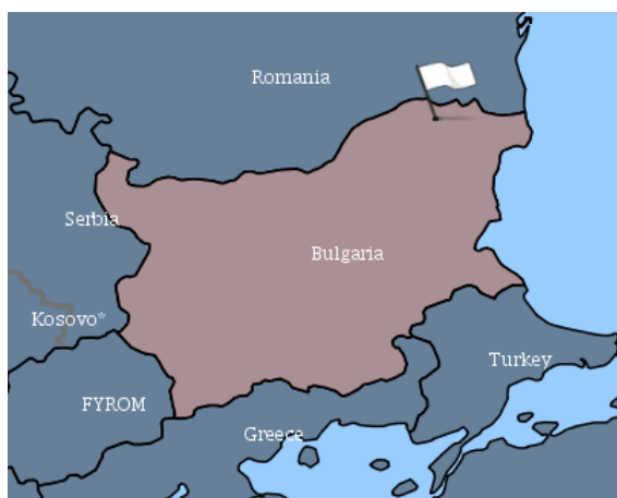
Огнище на АЧС в област Силистра

За периода 15-22.03.2019 г. в страната ни са регистрирани два нови случая на заболяването Африканска чума при дива свиня (АЧС) в землището на с. Цар Асен, общ. Алфатар, област Силистра и в землището на общ. Тервел, област Добрич.