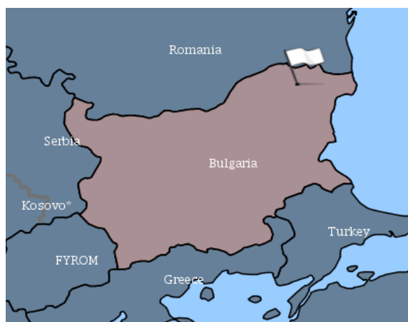
Огнище на АЧС в област Добрич

Румъния продължава да обявява нови случаи на АЧС при домашни и диви свине.