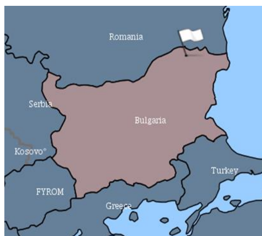
Огнище на АЧС в Силистра

Румъния продължава да обявява нови случаи на АЧС при домашни и диви свине.