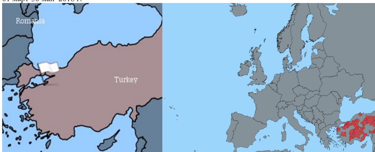
фиг. 2: Огнища на шап в Турция 01 март-30 май 2018 г.

Инфекциозна анемия по конете – Румъния, 1 първично епизоотично огнище в региона на Brasov.