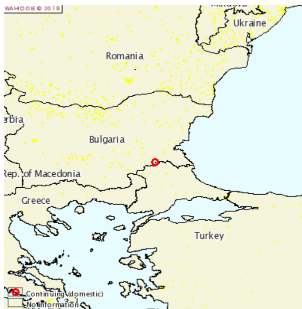
фиг. 1: Огнище на чума по дребните преживни животни, с. Воден, област Ямбол, България, 23.06.2018 г.

Чума по дребните преживни животни – България, на 23–ти юни т.г. е потвърдено огнище на чума по дребните преживни животни в с. Воден, община Болярово, област Ямбол, в близост до границата с Р. Турция. (фиг. 1)