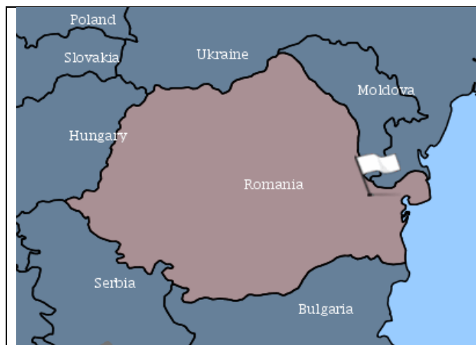
фиг. 2: Огнище на африканска чума при домашни свине в област Braila, Румъния, 03.07.2018 г.

Освен случаите при диви свине, през отчетния период се съобщава за нови огнища на Африканска чума при домашни свине в Украйна , 7 първични огнища в областите Cherkasy, Dnipropetrovs'k, по поречието на река Днепър и в Odessa. В Полша са установени 14 първични ЕО, повечето в пограничните области с Беларус и Украйна - Bialski (на границата с Беларус), Chelmski, Parczewski, Wlodawski (Беларус и Украйна) и Siedlecki и Braniewski (граничи с Калининградска област); в Латвия , 1 първично огнище, Литва , 5 първични огнища и 1 вторично огнище. В Румъния се съобщава за 93 първични ЕО в област Tulcea, а на 03 юли е потвърдено ново огнище във ферма тип „заден двор“ в област Braila (Chisani). (фиг. 2)