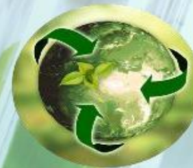
CIRCULAR FOOD SYSTEMS